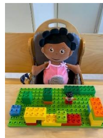
met duplo bouwen