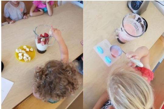
Stap 1 : stukje fruit stap 2: smoothie