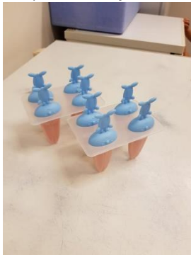
stap 3 : fruitijsje !!